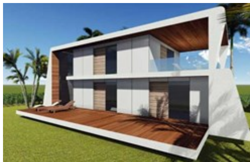
Vivienda hecha con sistema Comoplack

Una de las principales características del sistema es que lleva el aislamiento incorporado, por lo que permite cerrar una vivienda al mismo tiempo que se aísla de manera hermética sin puentes térmicos, convirtiendo cualquier construcción con Comoplack en ecoeficiente. Además el sistema es totalmente compatible y adaptable a los sistemas constructivos existentes actualmente, por lo que hace del producto el material ideal no solo para construcción de obra nueva, sino también para remodelación.