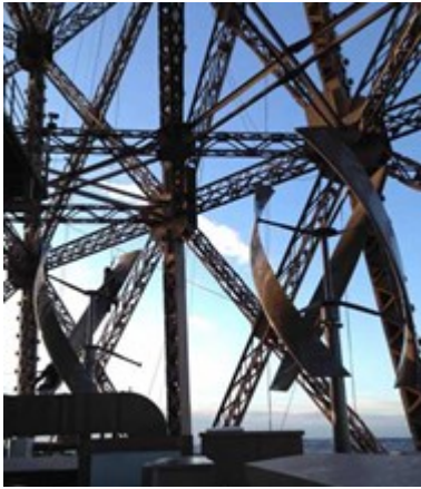
Torre Eiffel con turbinas eólicas

La torre Eiffel el monumento más visitado del mundo acaba de instalar dos turbinas eólicas de eje vertical que se ven ya a distancia. Esta instalación forma parte de la reforma que se está realizando para actualizar el monumento. Sin embargo no es la única tecnología que se ha introducido para convertir esta reforma en un proyecto de desarrollo sostenible.